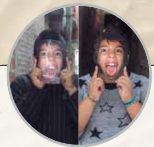
LETRAS: ★ DANIELA MÉRIDA ★

- La mayoría de los medios son neutrales y hablan de lo que ven sobre el terreno, pero algunos han sido descaradamente defensores del genocidio, como el diario La Nación, que perdió la ética y dejó de ser un medio transparente. A mi entender, ese comportamiento termina siendo una ofensa para el lector, porque seguramente quiere saber la verdad de la situación, pero ellos la esconden, insultando a nuestro pueblo. ★